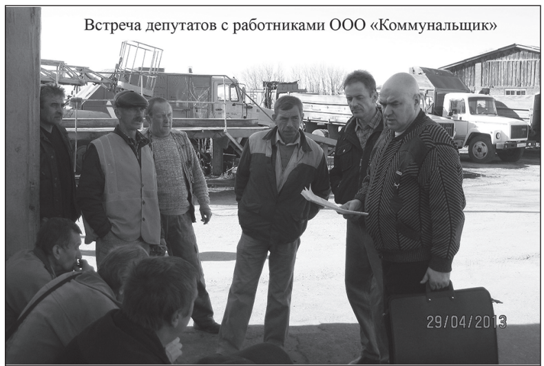
Встреча депутатов с работниками ООО «Коммунальщик»