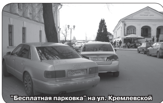
«Бесплатная парковка» на ул. Кремлевской

Интересно у нас все получается: город посещает 800 тысяч туристов, половина из них приезжает на своем автотранспорте, а это порядка 150 тысяч автомобилей. И если бы за парковку в течение дня они платили по 100 рублей (это по самым скромным подсчетам), то город имел бы неплохое подспорье в виде 15 миллионов рублей, которые могли бы пойти на бла-